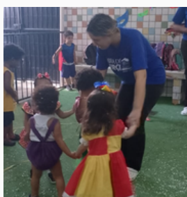
Festa de Natal