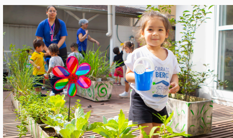
Vamos ajudar o meio ambiente!